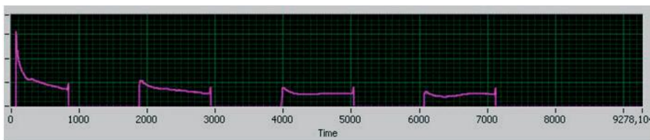
Рис. 1. Зміни електропровідності, відображені у графіку імідансу стінок тонкої кишки при подаванні імпульсів стабільної напруги 80 В

невідповідність для цього випадку закладених робочих параметрів. У зв'язку з цим авторами було запропоновано ввести стадію «електричної» підготовки тканини до створення з'єднання.