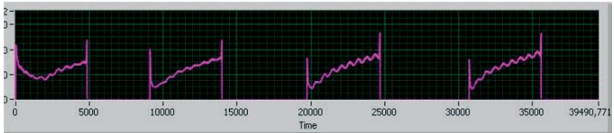
Рис. 3. Характер зміни імпедансу тканини під час подання імпульсів зі зростаючою амплітудою напруги від 80 В до 120 В

на екран в реальному часі цих значень, а також імпедансу та вкладеної в тканину потужності виконували за допомогою модуля швидкого аналого-цифрового перетворення та персонального комп'ютера.