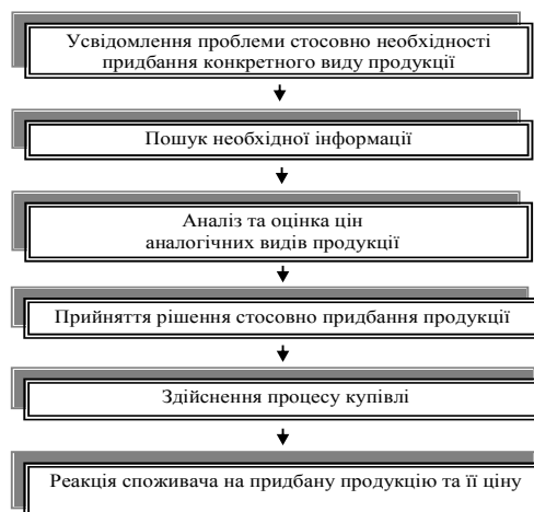
Рисунок 2 – Алгоритм формування рішення споживача та його судження про генеричну продукцію та рівень її ціни

Враховуючи особливості купівельної поведінки споживачів при зміні підприємством рівня ціни на продукцію, розроблено алгоритм формування їх рішення в процесі придбання продукції на ринку та їх поведінки в залежності від рівня ціни (рис. 2).