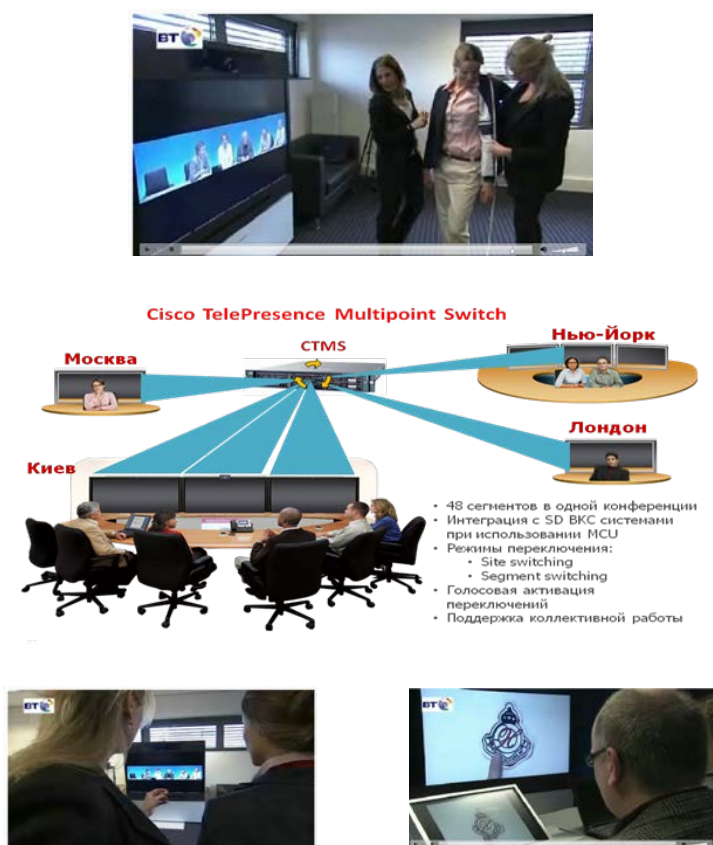
Рисунок 2 – Система интеграции центров моды разных стран в общем виртуальном рабочем пространстве, предназначенная для совместной работы распределённых творческих групп в глобальном масштабе

совместных дизайн-проектов на основе территориально разрозненных коллективов. Первая в индустрии моды реализация виртуальной примерочной для групповой работы дизайнеров была осуществлена группой компаний Tommi Hilfiger , известной в мире дизайна одежды. Офисы фирмы находятся на разных континентах и между ними на основе виртуальной примерочной организована совместная работа с эффектом телеприсутствия [26]. Пример организации аналогичной по функциональности системы, объединяющей центры мод разных стран, показан на рисунке 2.