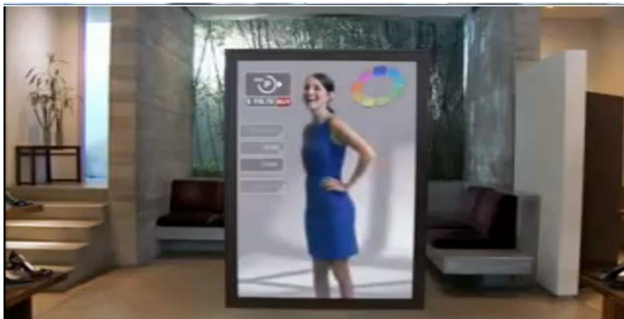
Рисунок 3 – Виртуальная примерочная типа «магическое зеркало»

«виртуальная примерочная» и «виртуальные зеркала», которые предназначены для посетителей магазинов [27]. Примеры того, как выглядят виртуальные аналоги привычных объектов традиционного шоппинга, показаны на рисунке 3.