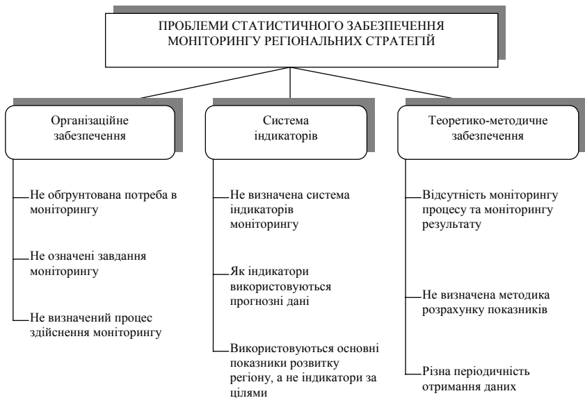
Рис. 1. Проблеми статистичного забезпечення моніторингу регіональних стратегій

Варто зазначити, що відібрані для задоволення інформаційних потреб моніторингу індикатори мають: