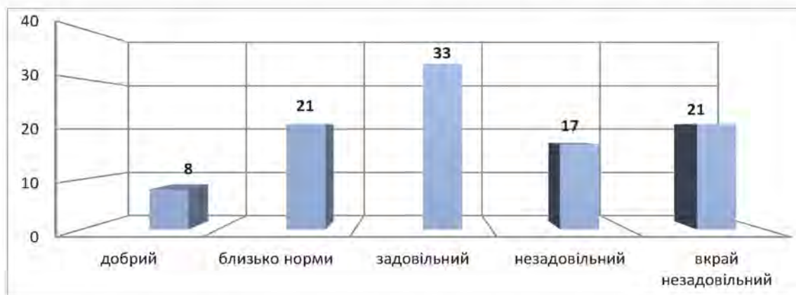
Рис. 2. Стан використання земельних ресурсів басейнів малих річок Західного Полісся України, %

Як свідчать результати проведеного дослідження «добрий» екологічний стан мають басейни річок Веселуха та Цир, що становить лише 8% від загальної кількості розглянутих малих річок (рис. 2).