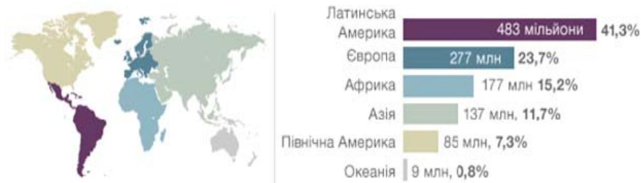
Таблиця 3. % католиків у світі за даними World Christian Database

Нагадаємо, що, як свідчить статистика Ватикану, на сьогодні у світі нараховується 1,2 мільярда римо-католиків. З них понад 40% католиків світу живуть у країнах Латинської Америки, але найбільший приріст католицьких парафіяльних структур останніми роками припадає на країни Африканського регіону. У Латинській Америці локалізовано 483 мільйони римо-католиків, або 41,3% світових католиків. У країнах Азії католиків також побільшало. В Азії сьогодні живуть 12% католиків світового соціального простору – 137 мільйонів (Таб. 3, Таб. 4) [Де у світі..., 2013].