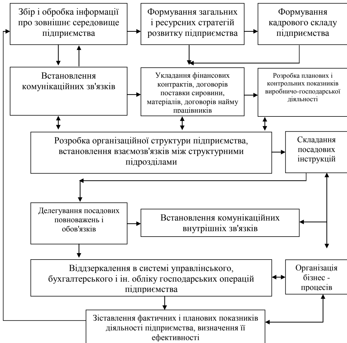
Рис. 2. Схема відтворювального процесу підприємства (з позиції пріоритету інформації як чинника виробництва)

Розглядаючи інформацію в контексті теорії чинників виробництва, слід підкреслити її вплив на відтворювальний процес підприємства.