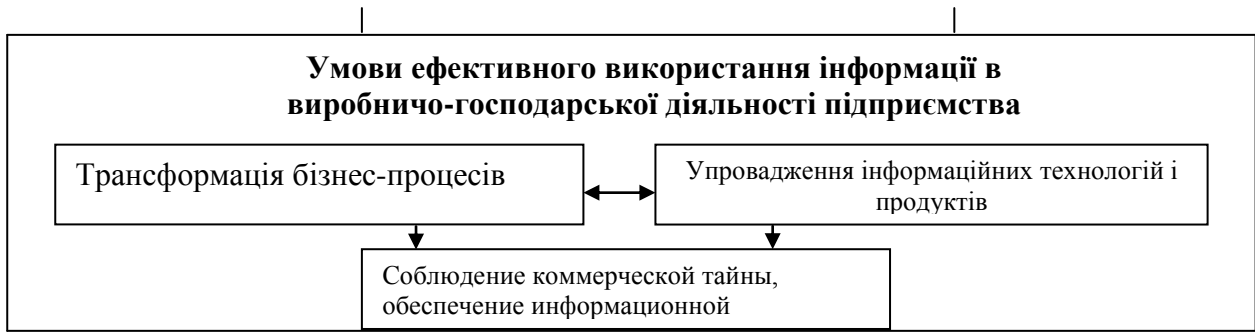
Рис.1. Суть інформації як чинника виробництва

Розглядаючи інформацію в контексті теорії чинників виробництва, слід підкреслити її вплив на відтворювальний процес підприємства.