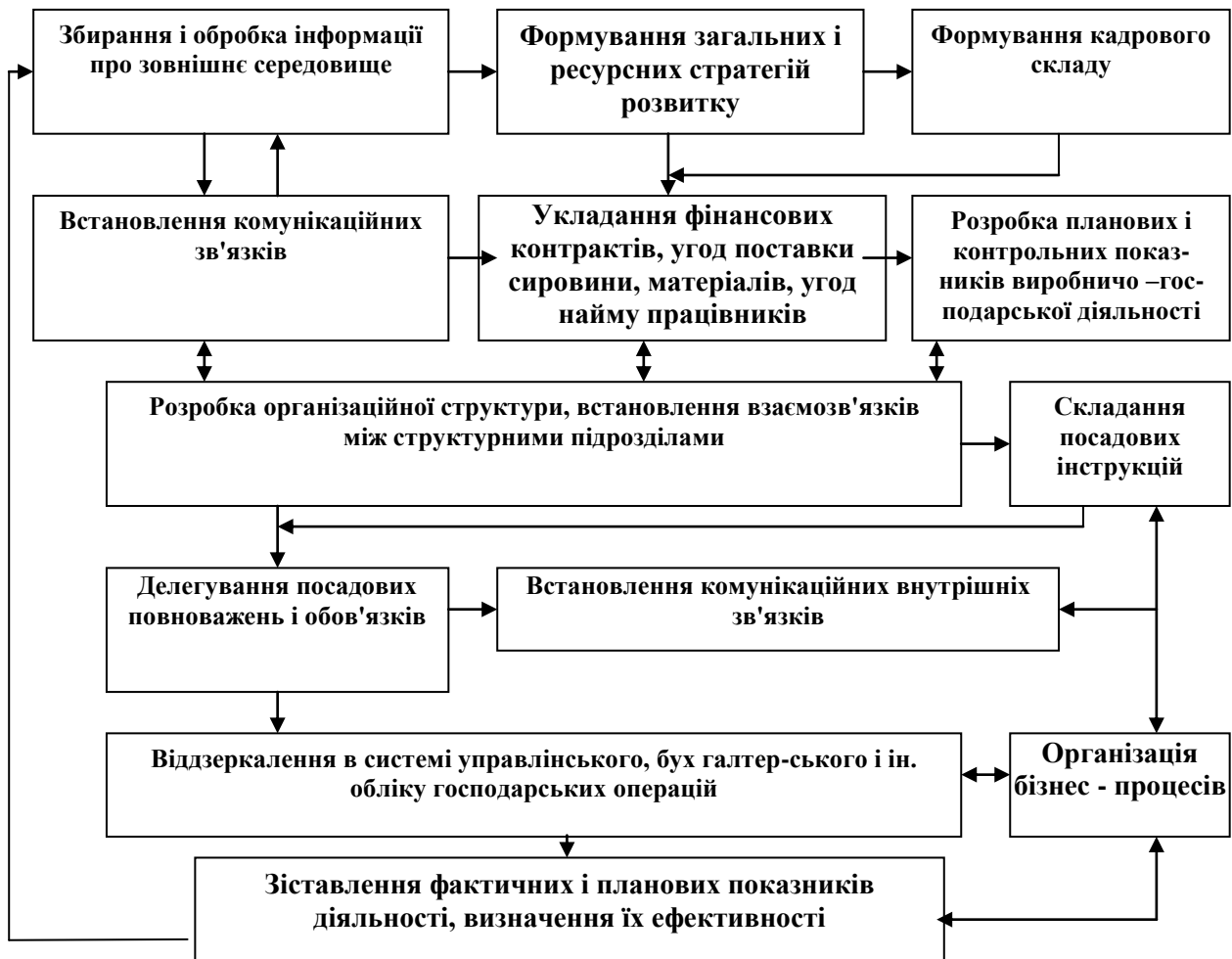
Рис. 1. Роль інформації у відтворювальному процесі економічного об'єкту

Оскільки даний етап відтворювального процесу припускає забезпечення економічного об'єкта персоналом, інформація виконує роль інтелектуального капіталу, втіленого в значення, уміння працівників.