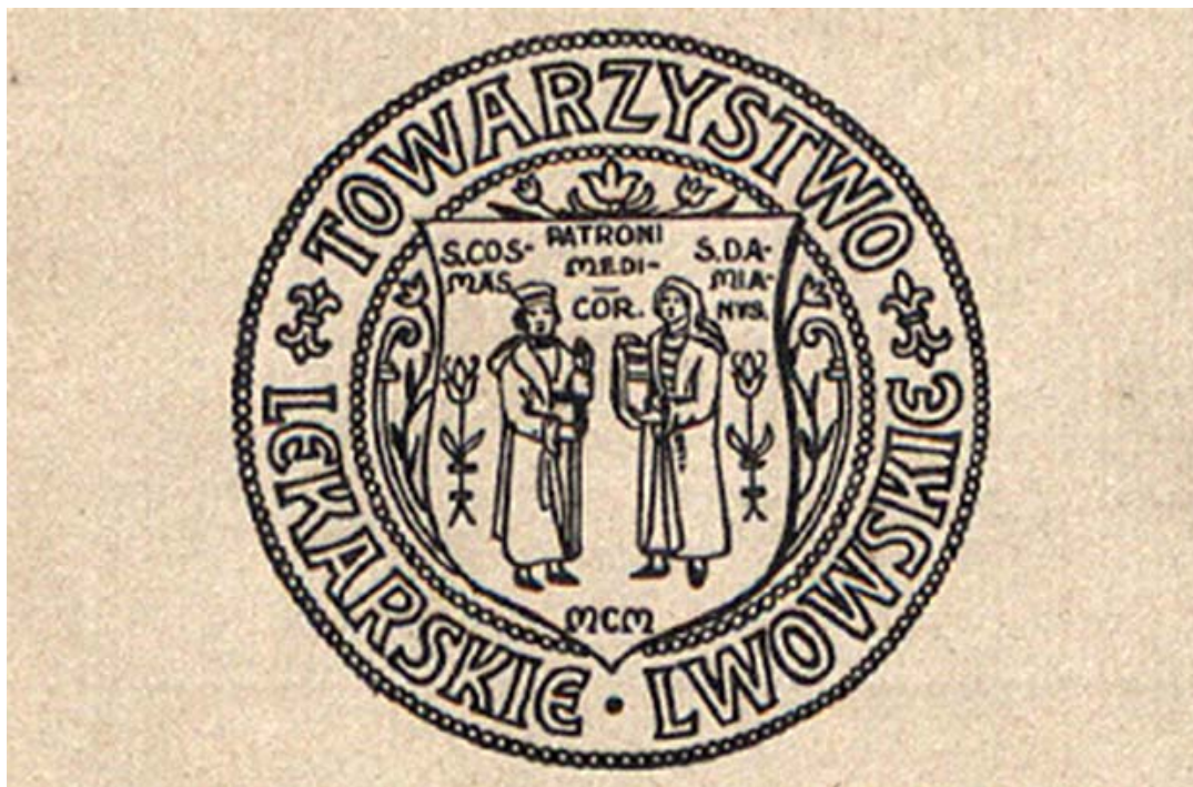
Рис. 2. Герб Товариства галицьких лікарів

З 1877 до 1900 р. діяла Львівська секція Товариства галицьких лікарів, завдяки якій вдалося спочатку в 1894 р. відкрити Лікарський відділ, а з 1897 р. розпочали діяльність перші клініки при медичному університеті [21] (сучасна вул. Чернігівська, 3).