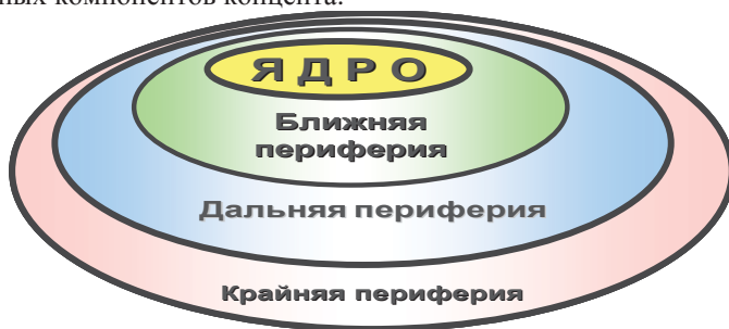
Рис. 2. Структура схемы содержания концепта

Структура концепта включает образующие концепт базовые структурные компоненты разной когнитивной природы - чувственный образ, информационное содержание и интерпретационное поле , и описывается как перечисление когнитивных признаков, принадлежащих каждому из этих структурных компонентов концепта.