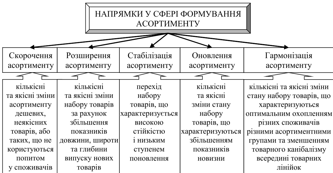
Рис. 2. Основні напрямки у сфері формування асортименту продукції