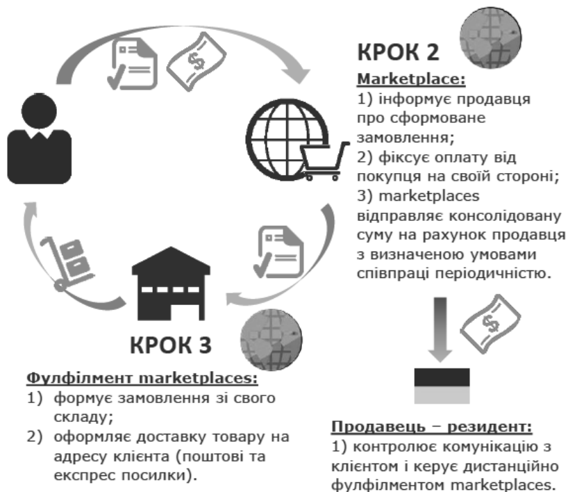
Рисунок: БІЗНЕС-МОДЕЛЬ 3

В цілому для e-commerce export використовують такі формати відправки: невеликий пакет (до 2 кг), звичайна посылка (до 30 кг) і посылка з оціночною вартістю (до 30 кг). Всю інформацію щодо вимог до упаковки, а інформацію про зразки і ціни, можна знайти на сайті Укрпошти.