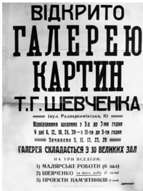
Афіша про відкриття Галереї картин Т. Г. Шевченка у м. Харкові, в якій працював М. Бурачек