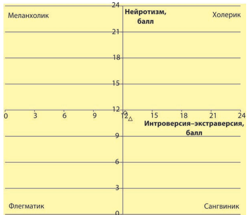
РИСУНОК 2 – Средние показатели типа темперамента членов сборных команд Украины по хоккею и баскетболу: Δ – хоккей; ◇ – баскетбол

Для составления всесторонне обоснованной программы отбора в спортивных играх необходимо рассмотреть вопрос о преобладающем типе сенсорной