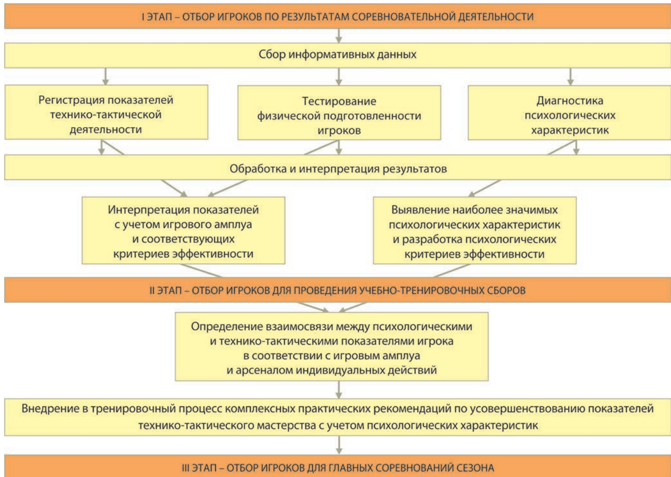
РИСУНОК 1 – Алгоритм комплексного отбора для сборных команд страны в игровых видах спорта