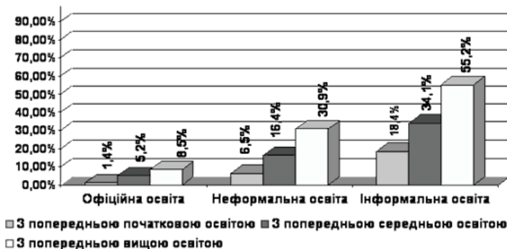
Рис. 3. Кореляція рівня попередньої освіти дорослого населення країн ЄС, що залучені до різних форм здобуття освіти

Результати дослідження. На ринку освітніх послуг розширюється поняття освітньої діяльності. Як освітню трактують будь-яку діяльність, яка має на меті змінити установки і моделі поведінки людини шляхом надання їй нових знань, розвитку вмінь та навичок. Функції освіти виконують не тільки заклади освіти, діяльність яких врегульована державою. Великі підприємства можуть мати у своєму складі підрозділи або відділи, що займають-