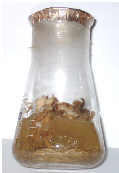
Рис. 4 Культивування кореневої культури Gentiana cruciata L. на живильному середовищі МС (D)