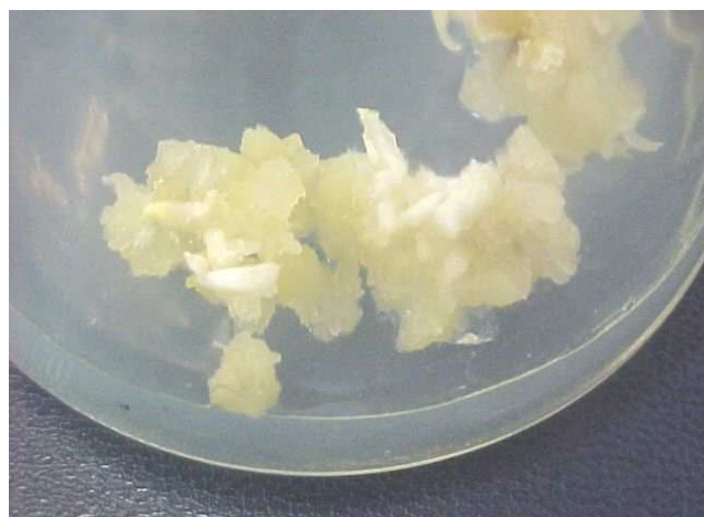
Рис. 3. Індукція ризогенезу з калюсу G.cruciata на модифікованому живильному середовищі МС (А, D) в умовах темряви

Аналіз отриманих результатів показав, що найбільш ефективною для ініціації коренеутворення з калюсної тканини G. cruciata виявилася концентрація ІОК – 1,0 мг/л у живильному середовищі, де частота ризогенезу становила – 85 %, а підвищення її вмісту в живильному середовищі до 3 мг/л інгібувало процес ризогенезу (57 %) (таблиця). Дія НОК та 2,4-Д на процес ризогенезу була позитивно помітною лише в поєднанні з ІОК.