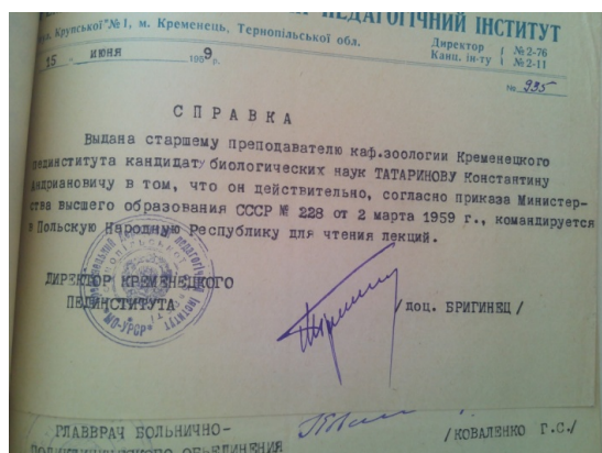
Рис. 1. Довідка про відрядження у ПНР для читання курсу лекцій із зоології.

Про це свідчить запрошення вченого до Познанського університету Польської Народної Республіки для читання курсу лекцій по зоології, зоогеографії, палеонтології та для збору наукового матеріалу (рис. 1). Однак, з невідомих причин, у червні 1960 року Управлінням зовнішніх відносин Міністерства вищої та середньої спеціальної освіти СРСР поїздку було відмінено (рис. 2).