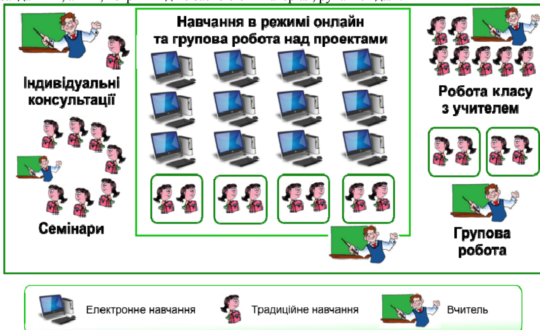
Рис. 6. Гнучка модель.

II. Гнучка модель (Flex Model) – модель змішаного навчання, в якій основою навчального процесу є он-лайн навчання. В межах моделі школярі навчаються за індивідуальним, утвердженим вчителем графіком, в режимі он-лайн на території школи. За умови виникнення труднощів учні можуть в будь-який час звернутися до вчителя-наставника за додатковим роз'ясненням. Отримавши базові знання з нової теми, учень приєднується до парної або групової роботи над плановими проектами, щоб удосконалити та поглибити отримані знання [2]. Використання цієї моделі під час вивчення іноземної мови буде дієвим у класі, де учні мають різний рівень сформованості мовленнєвих компетентностей. Вона дозволяє персоналізувати навчальний процес, надаючи можливість учням, що відстають з певної теми, довше працювати над певним завданням, а тим, котрі швидше засвоюють матеріал, рухатися далі.