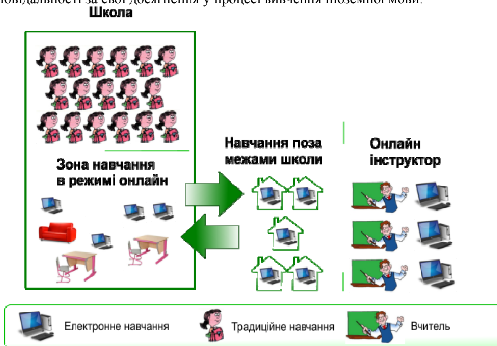
Рис. 7. Особистісно-орієнтована модель.

III. Особистісно-орієнтована модель (Self-Blend Model or A La Carte Model) – модель змішаного навчання, що передбачає відвідування традиційних занять разом з проходженням одного або декількох електронних курсів з окремих тем за вибором учня повністю у режимі он-лайн [2]. Вона може бути використана при потребі додати до програмних тем деякі факультативні теми у вигляді он-лайнових курсів (доступних в інтернеті або спеціально розроблених учителем), серед яких учні можуть обирати цікаві для себе та вивчати дистанційно. Наприклад, так до навчального процесу можна включити додатковий країнознавчий матеріал або рекомендації та завдання для підготовки до іспитів. Вказана модель може бути вдало втілена на базі старшої школи, адже потребує від учнів повного самоконтролю та відповідальності за свої досягнення у процесі вивчення іноземної мови.