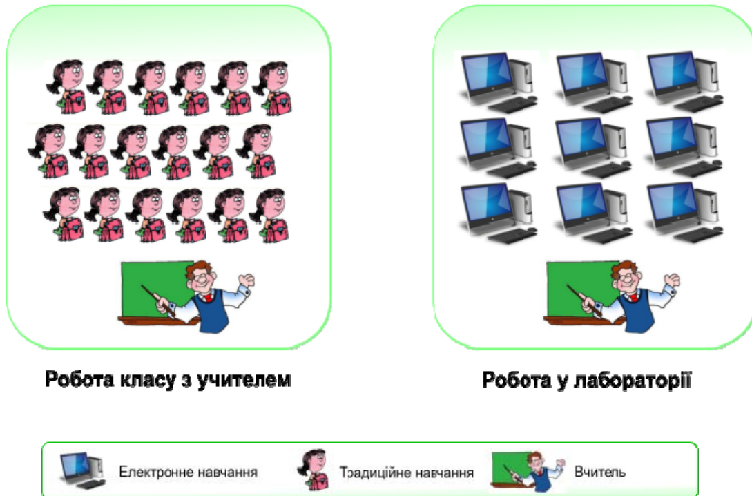
Рис. 3. Модель ротації між лабораторіями.

Модель ротації між навчальними лабораторіями є оптимальною для використання у молодшій та середній школі, адже дана модель включає контроль вчителя на всіх етапах роботи, а також забезпечує поєднання різних видів діяльності на уроці іноземної мови у ході неопосередкованого спілкування у класі та самостійної роботи з он-лайн курсами у спеціально облаштованій лабораторії.