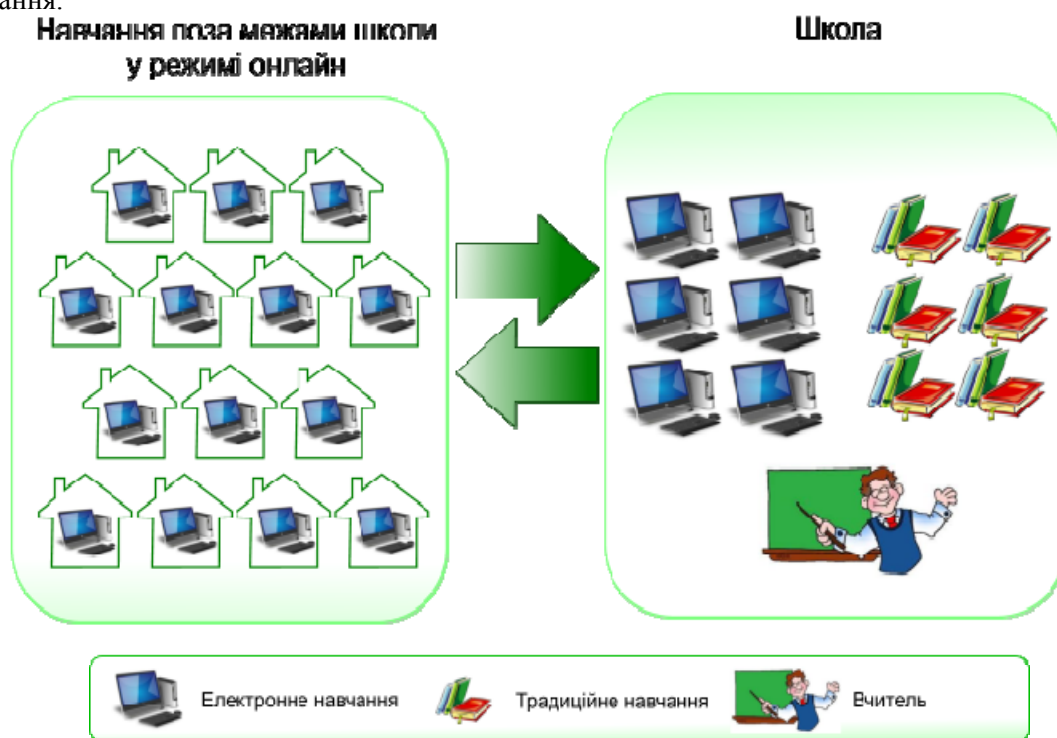
Рис. 8. Модель збагаченого віртуального середовища.

індивідуально або спільно з партнерами в групі співробітництва для досягнення персоналізації навчання.