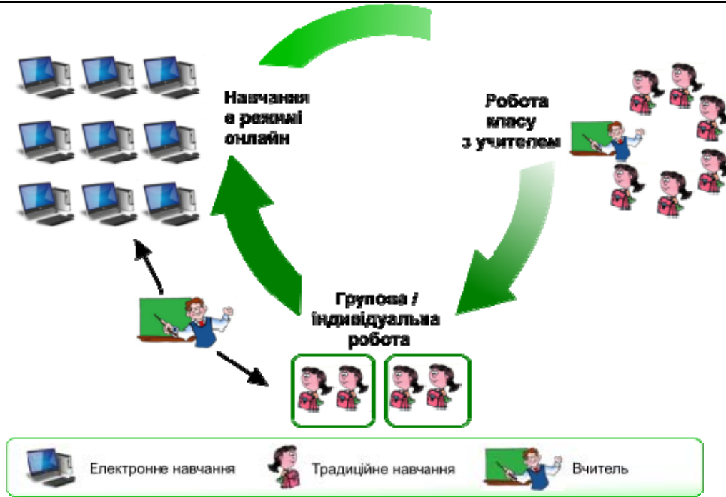
Рис. 2. Модель ротації між станціями.

Модель ротації між навчальними лабораторіями є оптимальною для використання у молодшій та середній школі, адже дана модель включає контроль вчителя на всіх етапах роботи, а також забезпечує поєднання різних видів діяльності на уроці іноземної мови у ході неопосередкованого спілкування у класі та самостійної роботи з он-лайн курсами у спеціально облаштованій лабораторії.