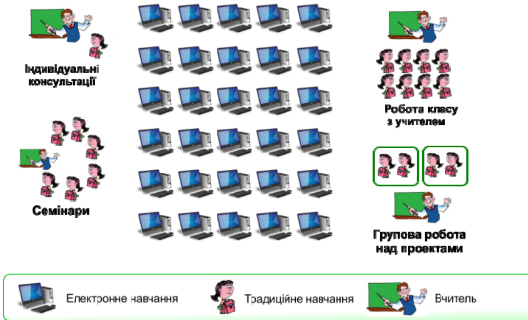
Рис. 5. Модель індивідуальної ротації

II. Гнучка модель (Flex Model) – модель змішаного навчання, в якій основою навчального процесу є он-лайн навчання. В межах моделі школярі навчаються за індивідуальним, утвердженим вчителем графіком, в режимі он-лайн на території школи. За умови виникнення труднощів учні можуть в будь-який час звернутися до вчителя-наставника за додатковим роз'ясненням. Отримавши базові знання з нової теми, учень приєднується до парної або групової роботи над плановими проектами, щоб удосконалити та поглибити отримані знання [2]. Використання цієї моделі під час вивчення іноземної мови буде дієвим у класі, де учні мають різний рівень сформованості мовленнєвих компетентностей. Вона дозволяє персоналізувати навчальний процес, надаючи можливість учням, що відстають з певної теми, довше працювати над певним завданням, а тим, котрі швидше засвоюють матеріал, рухатися далі.