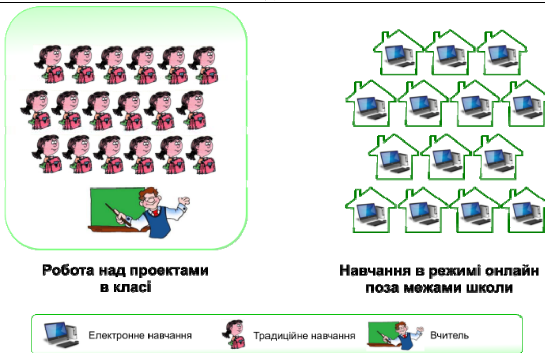
Рис. 4. Модель «перевернутого» класу.

3. Модель «перевернутого класу» (Flipped Classroom Model) – модель навчання, що передбачає ротацію учнів між наступними видами діяльності: робота з вчителем у класі (над проектами та практичними завданнями) та навчання он-лайн за межами школи після закінчення звичайних занять. Учні вивчають теоретичний матеріал переважно в режимі он-лайн у зручному для них місці та в зручний час, а практичні завдання вирішують разом з учителем у класі [1]. Школярі можуть самостійно опрацювати навчальний матеріал стільки часу й повторювати таку кількість разів, що їм потрібно, щоб зрозуміти та досконало оволодіти ним. Тож модель реалізує основне призначення змішаного підходу до навчання: дати учням можливість самостійно встановлювати та контролювати час, місце, програму та темп учіння. Вона найефективніша у роботі з учнями старшої школи, адже даний формат навчання передбачає самостійний контроль учнів за темпом учіння, а також за успішністю оволодіння потрібними вміннями і навичками та формуванням необхідної компетентності.