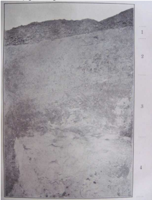
Рис. 2. Геологічний розріз [1, с. 17]: 1. Чорнозем (60-80 см), 2. Лес (2-3 м), 3. Залізовмісна глина (2-4 м) 4. Ооліт.

Науковець вважає галицький чорноземний край – природним продовженням русько-подільських чорноземів. Руський чорнозем охоплює території від південно-західного кордону європейської Росії до Уральських гір в напрямку ЗПЗ (захід-південь-захід) – СПС (схід-північ-схід) у формі нерівної та не скрізь однакової полоси. Чорноземний край охоплює території в межах Уфи (частково), Самари, Пензи, Саратова (частково), Воронежа, Тамбова, Харкова, Кубанського краю, Катеринослава, Полтави, Херсону (частково), Поділля (включно з Галицько-Подільським краєм) та Бессарабії (частково) [1, с. 1].