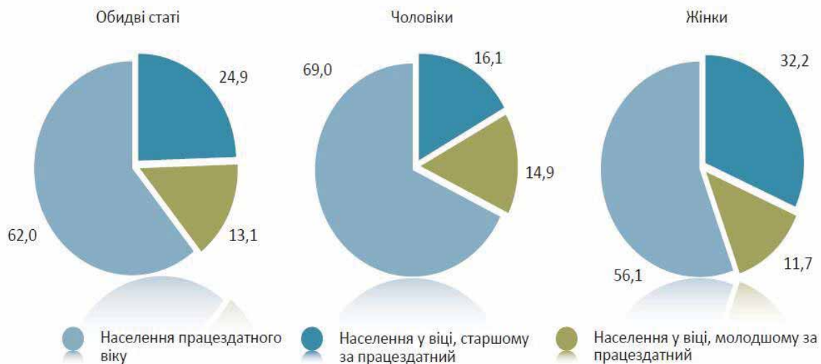
Рис.3. Населення працездатного і непрацездатного віку, 2011 рік, %

У 2011 році частка населення працездатного віку становила 62,0% (617 847 осіб), молодшого за працездатний вік, – 13,1% (130 966 осіб), старшого за працездатний вік, – 24,9% (248 265 осіб). При цьому, якщо серед чоловіків кількість населення у віці, старшому за працездатний, була лише дещо більшою за кількість населення у віці, молодшому за працездатний, то серед жінок кількість осіб у віці, старшому за працездатний, у 2,75 разів перевищувала кількість осіб у віці, молодшому за працездатний (рис. 3). Такий дисбаланс пояснюється більш ранньою межею непрацездатного віку для жінок. Водночас, якщо поррахувати частку чоловічого населення у віці, старшому за працездатний використовуючи таку ж межу пенсійного віку, як і для жінок (55 років і старше), то жіноче населення у віці, старшому за працездатний, все одно буде у 1,6 разів більше, ніж чоловіче, через більшу тривалість життя жінок [1, с. 18].