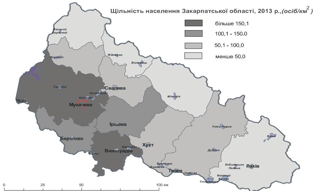
Рис. 2. Щільність населення Закарпатської області у 2013 році, осіб на км 2

Важливою демографічною умовою реалізації безперервного освітнього процесу є стан статеві-вікової структури населення. У Закарпатській області спостерігаємо зменшення населення, яке складає основний контингент загальноосвітніх закладів. Так, порівняно з 2000 р., у 2014 р. чисельність осіб віку від 0 до 14 рр. скоротилася на 7,5%, від 0 до 15 рр. скоротилася на 9,1%, від 0 до 17 рр. скоротилася на 14,6%. Проте, для старших вікових груп населення, зокрема від 16 до 59 та від 15 до 64 рр. спостерігалось збільшення чисельності. Їх показники відповідно зростають на 1,1 та 1,2%. Дана група населення є основою для формування і розвитку професійної освіти, постійного процесу підвищення кваліфікації трудових ресурсів Закарпатської області.