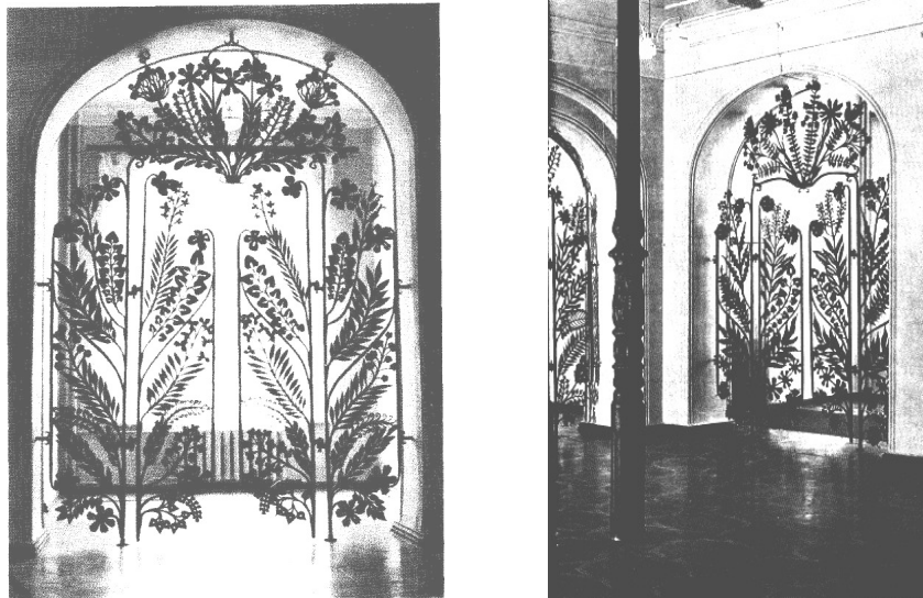
Рис. 2. Декоративна перегородка-двері у фойє філармонії в Києві. Метал, ковка. Художник А. Миловзоров.

рух кожної гілки, кожної квітки. Завершення композиції демонструвало розпущений привабливий куш, що через статичність вирішення рисунка виступав самостійним елементом у загальній композиції перегородки. Оригінальності твору добавляла різноманітна фактура обробки металу, що у кожному окремому випадку підкорялася формі листків та квітів. Ця перегородка-двері виділялася багатою художньою майстерністю виконання та виражала авторську любов до природи [2, с. 175].