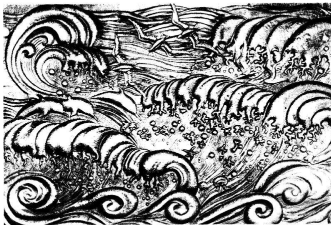
Рис. 1. Панно «Хвиля» у магазині «Океан», м. Київ, худ. А. Домнич

Інколи на площині стіни розміщувалися 3–5 панно, а подекуди вони займали всю площину стіни, наприклад, у магазині «Океан» в м. Києві. Тут інтерес викликали яскраві декоративні вставки в оформленні інтер'єру приміщення. Це цікаві вітражі і панно «Хвиля» (рис. 1), які виконав у техніці чеканки художник А. Домнич [2, с. 159].