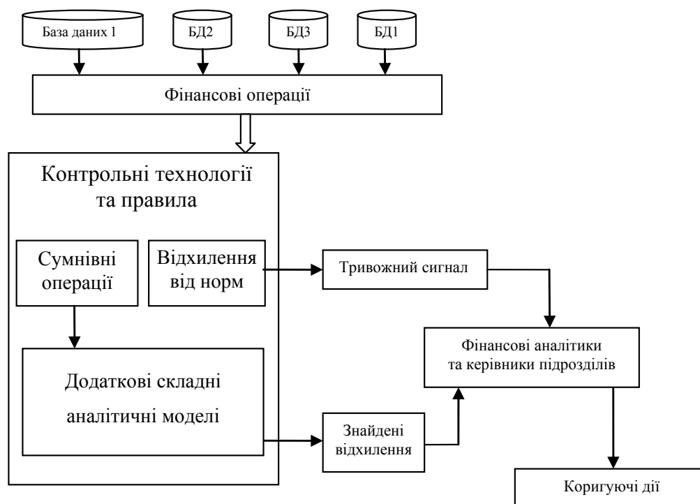
Рис. 1. Теоретична схема здійснення безперервного контролю

В ідеалі всі підозрілі операції мало б відстежувати те програмне забезпечення, яке їх обліковує,