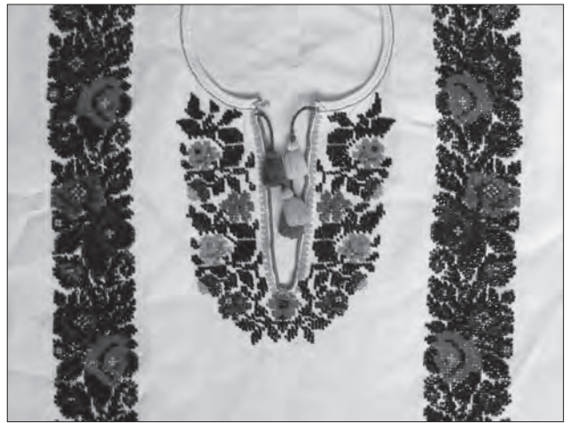
Сорочка жіноча. Фрагмент. Полотно, січка, бісер, вишивання півхрестиком. Кінець 1940-х рр., с. Звенячин Заставнівського р-ну Чернівецької обл. Чернівецький краєзнавчий музей, III—17001