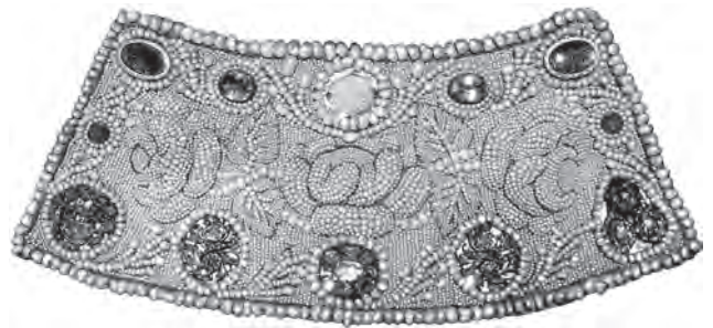
Поруч. Тканина, перли, золото, діаманти, рубіни, сапфіри, аметисти, скло, шиття по формі «у прикріп по карті». Кінець XVII ст., Україна. Музей історичних коштовностей України, ДМ-5983