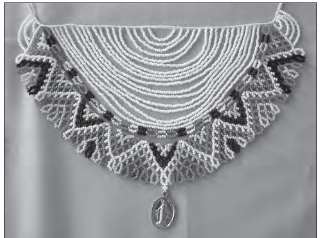
Сиянка. Бісер, нитки, набирання в разки, нанизування. 2007 р., Львів, творча студія Ірини Білик

бик, творчі пошуки яких базуються на спадщині українського народного мистецтва.