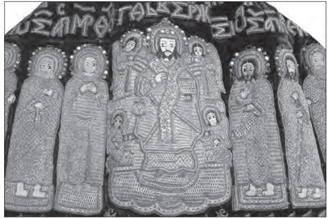
Фелон. Опліччя. Зелений оксамит, металеві та шовкові нитки, перли, лелітки, бісер, гаптування, шиття перлами та лелітками. XVII ст., Україна. ЧІМ, І-1197

XIX — середина XX ст. У першій половині XIX ст. продовжувала розвій дворянська маєткова культура, що природно пов'язувалася із загальними настроями романтизму. Зокрема, в українських помістях бісер та склярус використовували у виготовленні предметів обстави, які мали сприяти облаштуванню затишку та комфорту осель. Чимало вцілілих пам'яток, що нині зберігаються в музейних колекціях, географічно віддалених, Львова, Києва, Чернігова та інших українських міст, засвідчують поширеність, як також багатогранність явища: вишиті бісером картини [3; 11; 2; 18], панно, чохла на меблі [55, іл. 39—42], вишиті та вив'язані з бісеру чохла для побутових речей [12], обкладинки для записників та книжок [7; 13], подушечки для голок [6] тощо. Найтипівішими для цілого століття творчості з бісером стали картини з вишитими романтизованими пейзажами або сюжетними композиціями на тлі тих таки пейзажів,