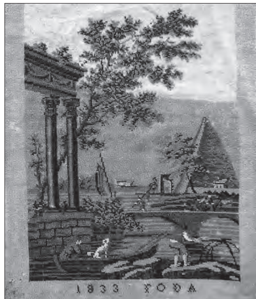
Картина (незавершена). Полотно, бісер, вишивання півхрестиком. 1833 р., Україна. Національний музей історії України, Т-5825