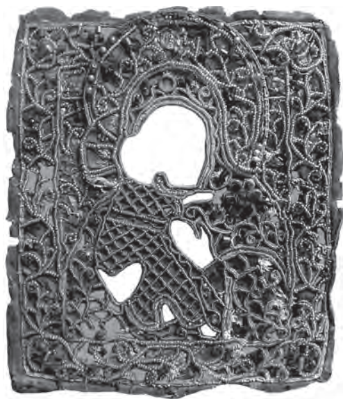
Шата ікони «Богородиця з дитям». Кінець XIX ст., Україна. Полотно, бісер, «шиття у прикріп по біллі». Національний Києво-Печерський історико-культурний заповідник, Т-5360