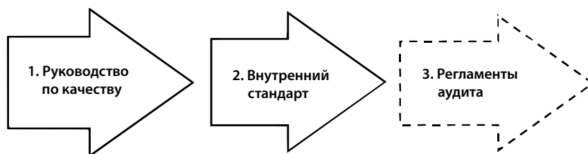
Рис. 2. Рекомендуемая структура документационного обеспечения системы управления качеством аудита

Место регламентов в системе документационного обеспечения СМК аудита представлено на рисунке 2.