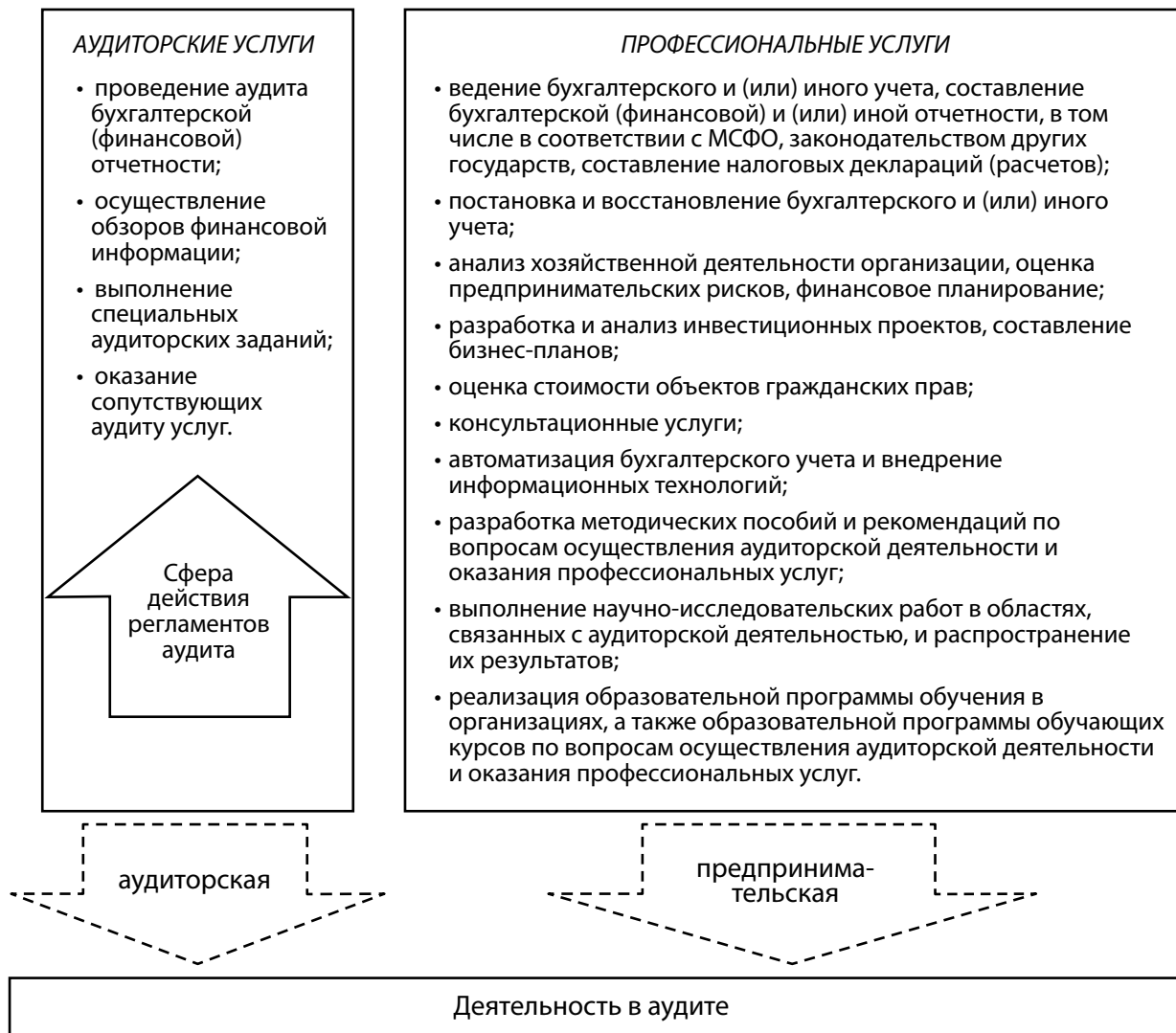
Рис. 1. Детализация видов деятельности в аудиторских организациях (ИП)

Источник: авторская разработка на основе Закона Республики Беларусь «Об аудиторской деятельности» [2].