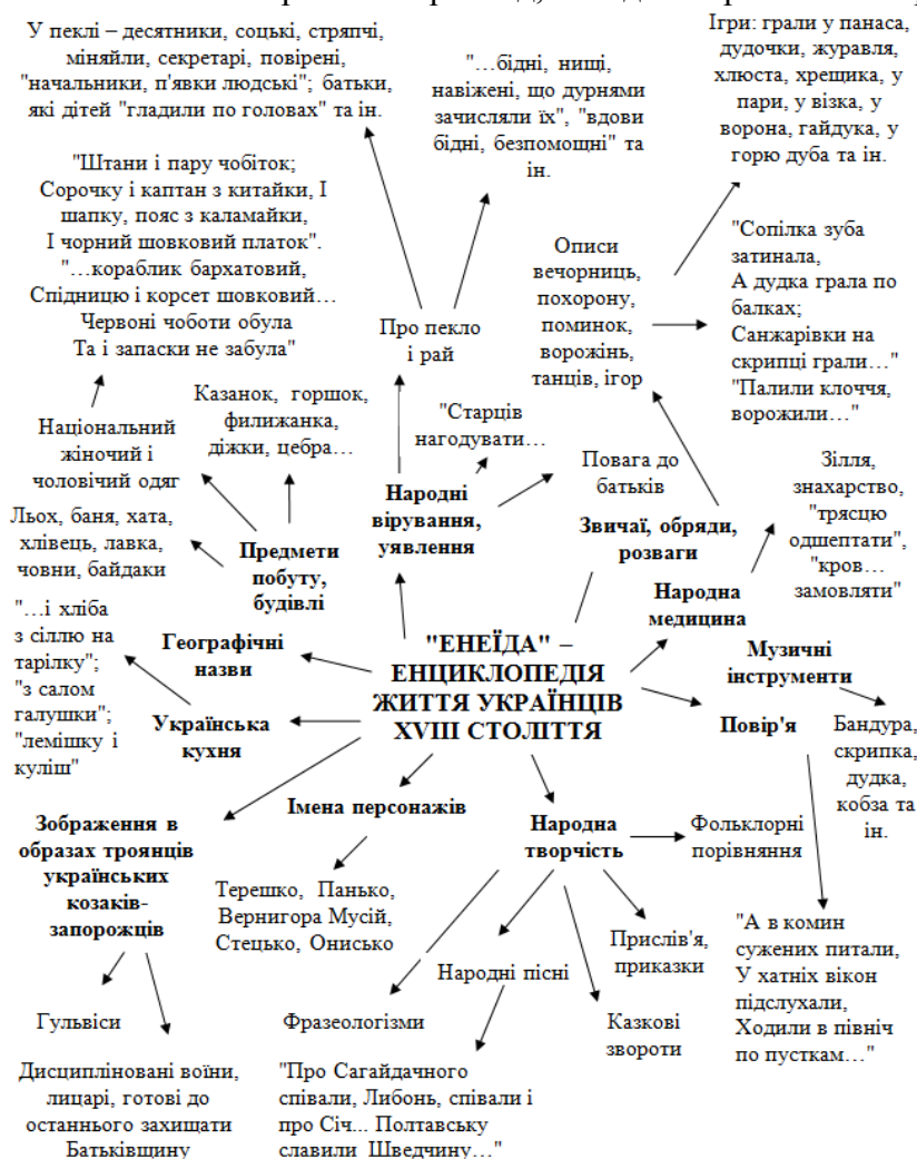
Рис. 1. Кластер "Енеїда" П. Котляревського – енциклопедія життя українців

Така діяльність розвиває в учнів здатності аналізувати, визначати головне, те, що характеризує й розкриває сутність, установлювати логіку, оцінювати, тобто узагальнювати і систематизувати навчальний матеріал. Як приклад, наводимо зразки кластерів (рис. 1, 2).