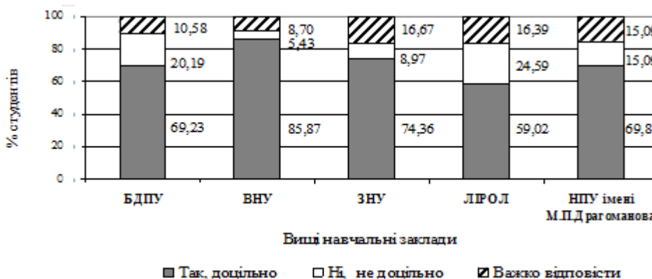
Рис. 1. Розподіл студентів, опитаних про доцільність здійснення підготовки майбутніх учителів фізичної культури до впровадження здоров'язбережувальних технологій у старшій школі (%)

Для виявлення стану підготовки майбутніх учителів фізичної культури до впровадження здоров'язбережувальних технологій у старшій школі було проведено анкетування студентів вищих навчальних закладів, у якому брало участь 465 осіб. Респондентами виступили 104 студенти Бердянського державного педагогічного університету, 78 студентів Державного вищого навчального закладу «Запорізький національний університет», 92 студенти Східноєвропейського національного університету імені Лесі Українки (ВНУ імені Лесі Українки), 122 студенти Луцького інституту розвитку людини «Україна», 69 студентів Національного педагогічного університету імені М.П. Драгоманова. Вважають, що доцільно здійснювати підготовку майбутніх учителів фізичної культури до впровадження здоров'язбережувальних технологій у старшій школі 71,66% студентів, вважають, що не доцільно здійснювати підготовку 14,85% студентів, важко було відповідати 13,49% студентів. Аналіз відповідей свідчить про те, що значна кількість респондентів переконливо вважає, що у сучасний період доцільно здійснювати підготовку майбутніх учителів фізичної культури до впровадження здоров'язбережувальних технологій у старшій школі (рис. 1).