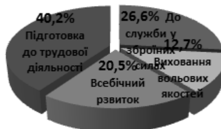
Рис. 2. Результати опитування студентів I курсу щодо ролі фізичної культури у їхньому житті.

За даними результатів дослідження встановлено, що одним з показників орієнтації на фізичне вдосконалення можна вважати наявність інтересу студентів до спортивного життя, де 63% респондентів вказали, що вони читають спортивні газети, спортивну літературу, дивляться спортивні передачі, виявляють увагу до спортивних подій університету, країни. Експериментально з'ясовано, що джерелами інформації в області фізичної культури для студентів є телебачення і радіо 42,4%; книги, журнали і газети 31,8%; 15,5 % студентів вважають, що основними джерелами знання для них з'явилися практичні заняття з фізичного виховання і тільки 10,3% студентів відзначають значимість лекцій з фізичного виховання. Результати опитування студентів I курсів (Рис. 2) показали, що головним на заняттях з фізичної культури студенти вважають досягнення всебічного розвитку 20,5%, підготовку до трудової діяльності 40,2%, захисту Батьківщини 26,6%, виховання вольових якостей 12,7%.