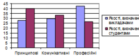
Рис. 3. Загальна картина протиріччя уявлень про морально-вольову сутність моделі студента

Бачимо, що саме професійні (зважаючи на висновок щодо даних в табл. 1. – виконавські) якості викладачі поставили на перше місце. Студенти ж, навпаки, ставлять принципові якості як запоруку розвитку, з їх точки зору, особистості. Середньозважені ж результати (Рис. 4) репрезентують майже рівну необхідність всіх трьох груп якостей для повноцінного розвитку студента, звісно професійні якості є найбільш бажаними, принципові на другому місці, комунікативні завершують список. Моделлю майбутнього викладача, згідно цього висновку, є професіонал з високими моральними устоями, котрий в той же час може створити сприятливу атмосферу у колективі, залишаючись при цьому лідером.