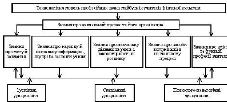
Рис. 2. Технологічна модель професійних знань майбутніх учителів фізичної культури

Оскільки сучасний період розвитку української держави ставить більш високі вимоги як до освітнього, так і фізичного розвитку підрастаючого покоління, то майбутній вчитель фізичної культури повинен технологічно підвищувати свій якісний рівень, який відповідає потребам нинішнього суспільства, удосконалюватися та створювати оптимальні умови для всебічного й фізичного розвитку особистості кожного учня.