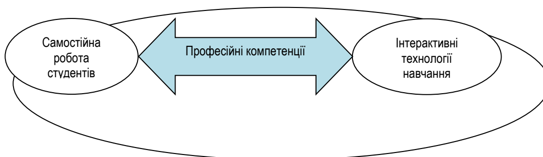
Рис. 2. Підхід до формування професійних компетенцій

На рисунку 2 показаний один з можливих підходів до формування професійних компетенцій.