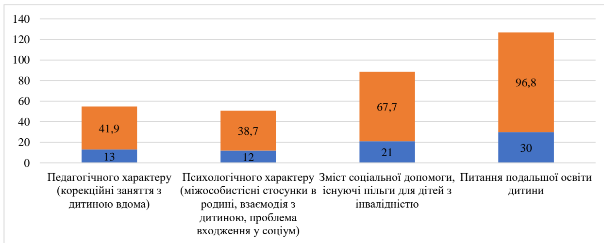
Рис. 2. Відповіді респондентів на запитання “Якої саме інформації Вам не вистачає і хотіли б отримати?”

У контексті отримання освітніх послуг, а саме щодо закладу освіти “Центр розвитку дитини “Я+сім’я”, більшість батьків (27 осіб; 87,1 %) оцінили як “задовільно” та одна особа (3,2 %) – “чудово”. Варто зазначити, що батьки потребують додаткової інформації з питань виховання, навчання дитини, догляду (21 осіб; 67,7 %). На рис. 2 представлено відповіді щодо видів цієї інформації.