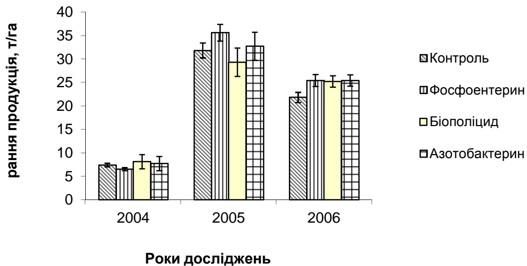
Рис. 3. Вплив біопрепаратів на вихід ранньої продукції помідорів сорту Шанс при вирощуванні розсадним способом (польові дослідження, чорнозем південний, 2004-2006 рр.)

перевищував контроль (рис. 3). Кращі показники виходу ранньої овочевої продукції було одержано і на інших варіантах із застосуванням препаратів, які володіють стимулювальними властивостями.