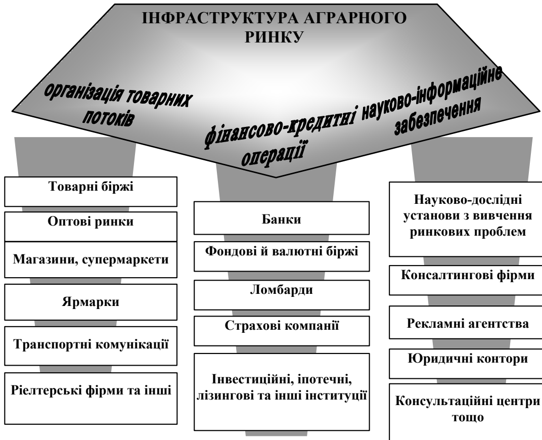
Рис. 2. Елементи інфраструктури ринку сільськогосподарської продукції

Виготовлена продукція в аграрних підприємствах будь-якої форми власності проходить через комплекс елементів інфраструктури, спрямованих на доведення її до споживача, через систему різних складових, які забезпечують процес обміну. Узагальнюючи різні концептуальні підходи вчених, за функціональним призначенням елементи інфраструктури ринку сільськогосподарської продукції можна поділити на три підсистеми (рис. 2).