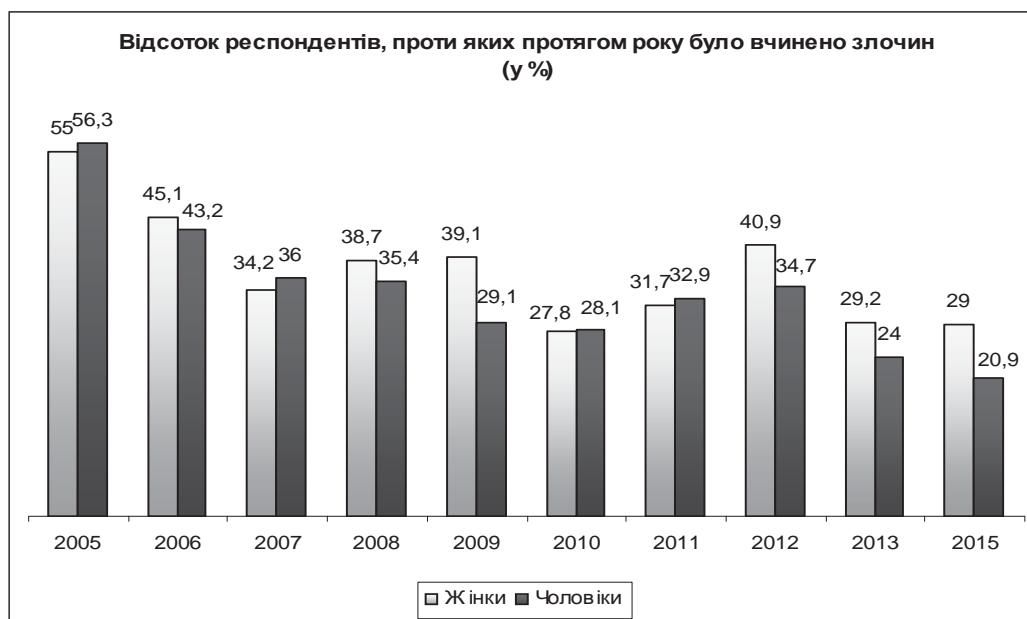
Рис. 2. Відсоток проанкетованих жінок та чоловіків, які стверджували, що протягом останнього року проти них було вчинено злочин (у % від загальної кількості респондентів певної статі)

Протягом розглядуваного періоду відсоток постраждалих від злочинів серед жінок був дещо вищим, ніж серед чоловіків (рис. 2). Різниця складала від 1 % до 10 %. Це пов'язано як з переважанням жінок у гендерній структурі київського студентства, так ймовірно і з більш свідомим ставленням жінок до заповнення анкет.