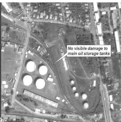
Рис. 3. Порт Поті. Відсутні ознаки пошкоджень резервуарів