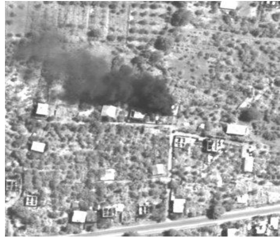
Рис. 1. Космічний знімок селища Курта (зроблено американським супутником WorldView-1)

За супутниковими даними встановлено, що селище Тамарашені зруйновано на 50%, селище Квемо Ачабеті – на 51,9%, селище Земо Ачабеті – на 41,6%, селище Курта – на 43,4%, селище Кехві – на 44,3%, селище Кемерті – на 30,6%, селище Дзарцеми – на 15,3%.