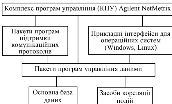
Рис. 1. Архітектура HP OpenView Network Node Manager

СУ КМ HP OpenView Network Node Manager використовує розподілену ієрархічну модульну архітектуру (рис. 1).