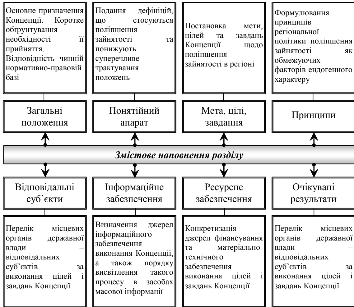
Рис. 2. Типова структура Концепції поліпшення зайнятості населення Тернопільської області на період до 2025 року [5, с. 148].

пропонованої нами Концепції відрізняється визначення зайнятості (згідно з Законом України «Про зайнятість населення») [7]. Інші дефініції в нормативно-правових документах чітко не регламентуються.