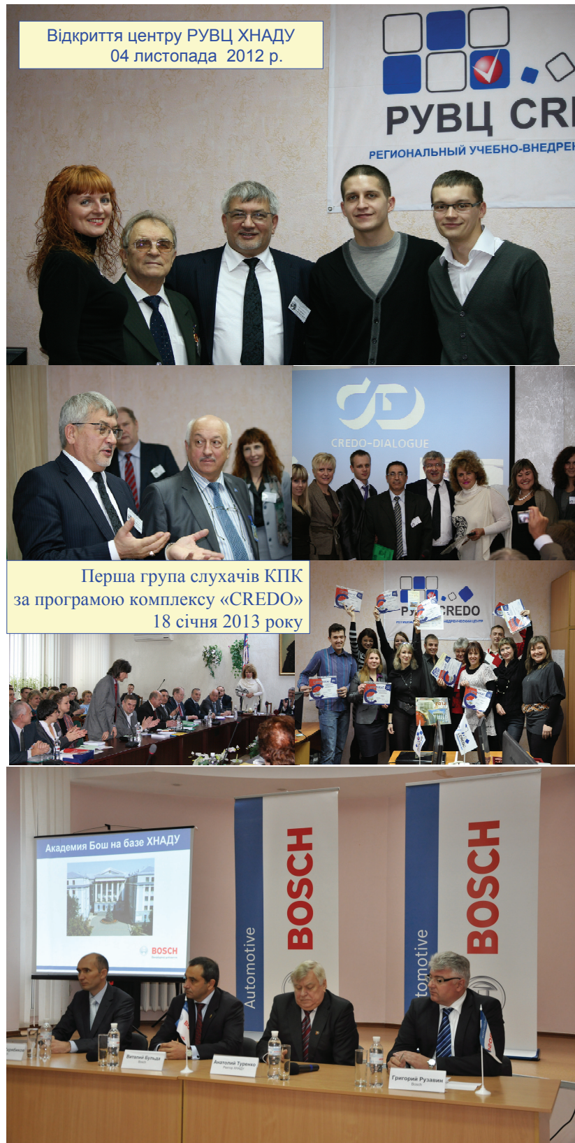
Рис. 2. Відкриття спільних навчальних центрів з ПДО в ХНАДУ

програм таких курсів ніким не контро- люється, користь і якість від них може