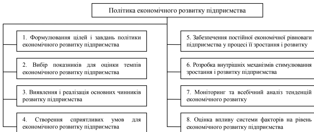
Рис. 1. Основні елементи політики економічного розвитку підприємства

Природними цілями економічного зростання і розвитку є якість і високий рівень життя. Саме по собі економічне зростання достатньо суперечливе. Наприклад, можна досягти збільшення виробництва і споживання матеріальних благ за рахунок погіршення їх якості, можливий варіант отримання економії на очисних спорудах або погіршенні умов праці. Досягти тимчасового зростання виробництва можна і за рахунок хижачкої експлуатації ресурсів. Але таке зростання або не стійке, або взагалі позбавлено сенсу. Тому економічне зростання має сенс тоді, коли воно поєднується із соціальною стабільністю і соціальним оптимізмом [4, с. 266].