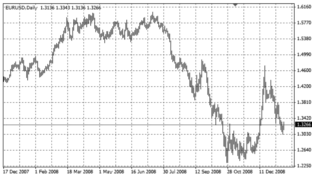
Рис. 3. Динаміка валютної пари EUR/USD [5]

(рис. 3). Можна зробити висновок про причини, що призвели до такого дисбалансу.