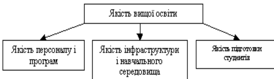
Рис. 2. Структура якості вищої освіти

Тлумачення процесу пошуку "якості" припускає вивчення питань, які стосуються якості підготовки педагогів, інфраструктури й навчального середовища. Тому якість вищої освіти можна представити у такому вигляді (рис. 2).