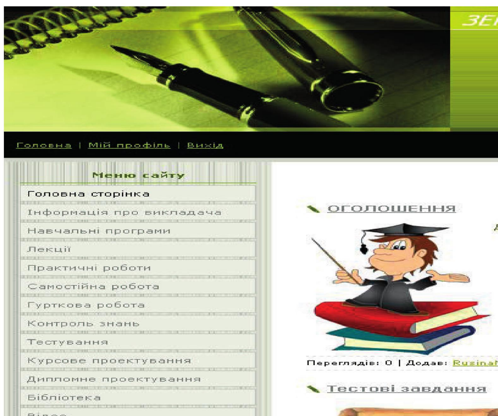
Рис. 3. Меню сайту

Інтернет-сайт навчальної дисципліни «Землепорядне проектування» є електронним навчально-методичним комплексом. Структура сайту представлена у «Меню сайту» (рис. 3).