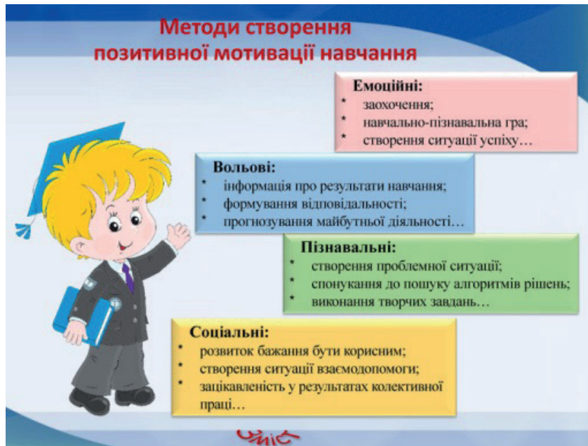
Рис. 3. Методи створення позитивної мотивації до навчання

(див. рис. 3), спрямовані на формування позитивних мотивів учіння, стимулювання пізнавальної активності, збагачення учнів навчальною інформацією, зокрема через методи формування інтересу до навчання (пізнавальні ігри, цікаві досліди, методи емоційного стимулювання, робота над проектами тощо).