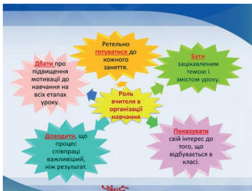
Рис. 2. Роль учителя в організації мотивованого уроку

Мотивація на уроці – це не одноразова акція, а цілеспрямована й клопітка праця, покликана організувати й тримати в полі зору учнівський інтерес до пізнання нового впродовж усього навчального часу. Особлива роль в організації такого освітнього процесу відводиться майстерності вчителя (див. рис. 2).