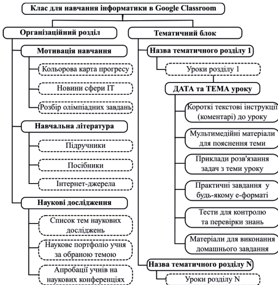
Рис. 1. Структура віртуального Класу для навчання інформатики в Google Classroom

Розробка структури віртуального Класу в системі Google Classroom та наповнення його змістом є основним завданням учителя, його творчою розробкою. У ході роботи з упровадження експерименту з організації віртуального класу ми стикнулися з тим, що дітям важко орієнтуватися у великій кількості дописів і фрагментів, тобто їм зручніше бачити на екрані заплановані на увесь навчальний рік класи з окремих предметів. Тому віртуальний Клас із будь-якого предмета бажано називати за таким шаблоном: «назва предмета; клас; навчальний рік». Для організації та проведення уроків інформатики, зважаючи на отриманий досвід, нами була розроблена така структура віртуального Класу в Google Classroom (див. рис. 1):