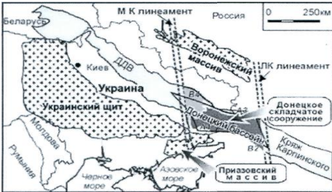
Рис. 1. Геоструктурная позиция Донецкого бассейна

На участке Донбасса, разрывы, ограничивающие палеорифт, наложены на более древние линейные структуры линеamentного пояса, включающие транскоровые Мариупольско-Курский и Липецко-Константиновский линеamentы (рис. 1).