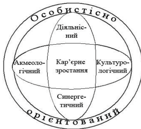
Рис. 1. Кар'єрне зростання у фокусі різних методологічних підходів

Виклад основного матеріалу дослідження. Проблема цілісного підходу до розгляду кар'єрного зростання як складного особистісно-розвивального процесу знаходиться у фокусі різних методологічних регулятивів. Цей феномен пов'язаний із синтезом дії всіх психічних явищ особистості, а, отже, його дослідження не може здійснюватися з локальних позицій і знаходиться на перетині акмеологічного, синергетичного, діяльнісного й культурологічного підходів. Траєкторія їх регулятивного впливу є особистісною.