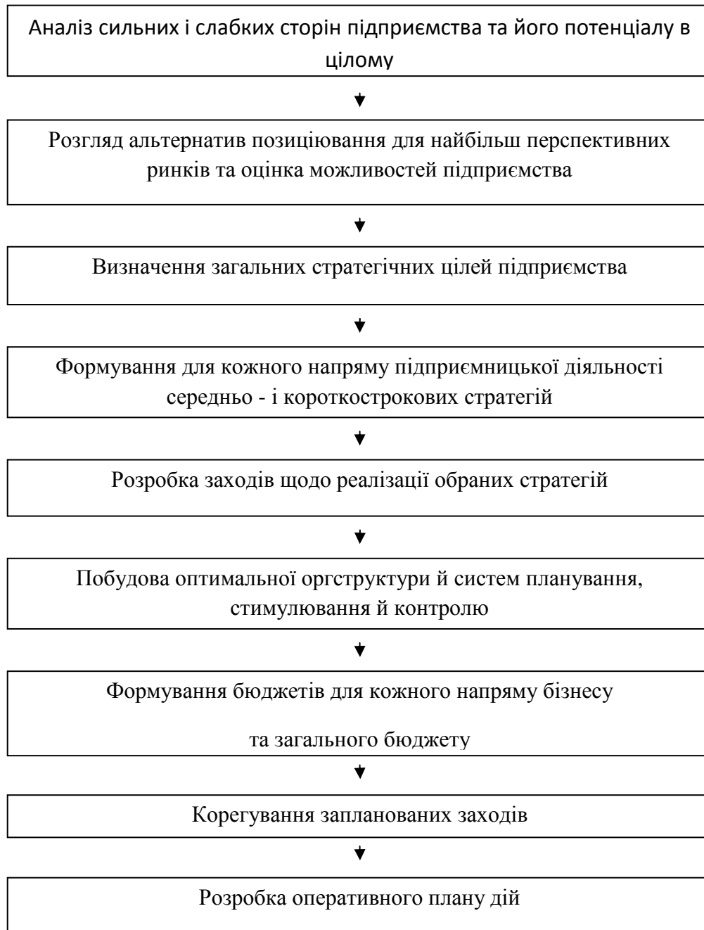
Рисунок 2 -Алгоритм впровадження реінжинірингу на підприємстві

Кількісний опис бізнес-процесів характеризують відповідні операційні бюджети, згодом вони перетворюються у відповідні фінансові: бюджет руху грошових коштів, бюджет доходів і витрат, прогнозний баланс тощо. Урахування особливостей бюджетування дозволяє аналітикам створювати типові кількісні описи підприємницької діяльності підприємства.