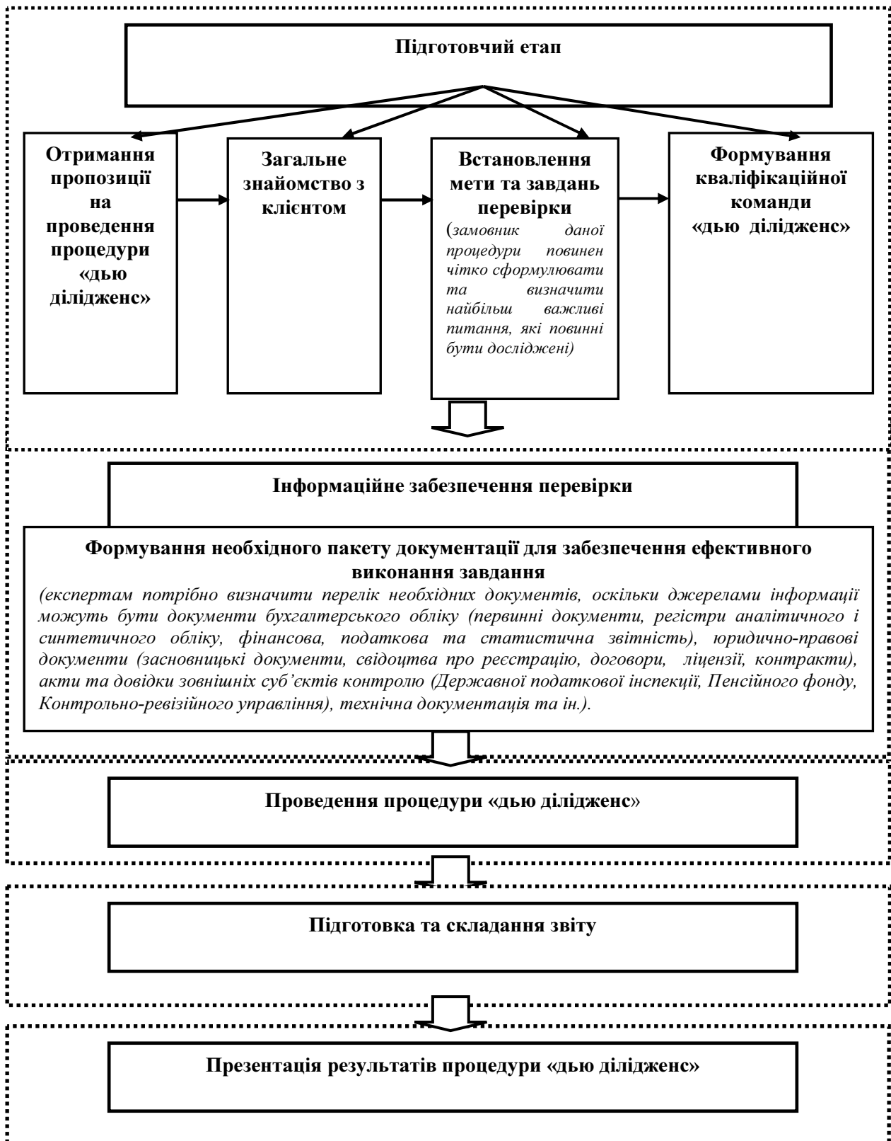
Рисунок 2 – Алгоритм проведення процедури «дью ділідженс»

Підготовчий етап процедури «дью ділідженс» повинен охоплювати такі аспекти: укладання договору, формування кваліфікаційної команди та встановлення цілей перевірки.