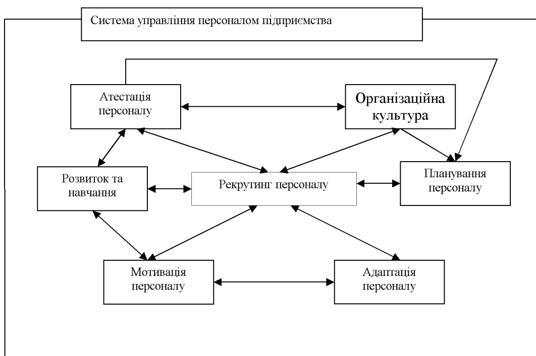
Рисунок 2 – Місце та взаємозв'язок рекрутингу персоналу у СУП підприємства

Як вже зазначалося вище, рекрутинг персоналу має важливий вплив на розвиток СУП (рис. 2). Роль рекрутингу персоналу визначається тим, що саме якісний підбір персоналу дозволяє сформувати ефективну команду спеціалістів, які готові завжди виконувати свою роботу якісно та чітко.