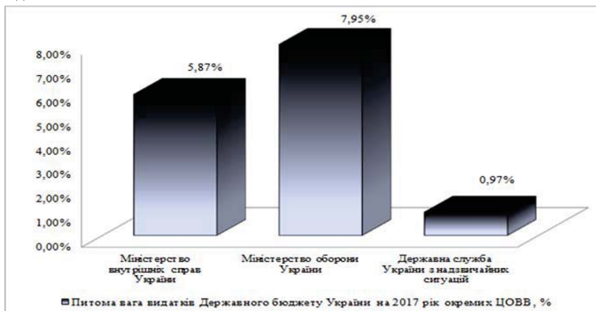
Рисунок 1 – Питома вага видатків Державного бюджету України на 2017 рік окремих ОВВ, %

Ситуація з придбанням пожежної техніки у 2019 році покращилася і Державним бюджетом на 2019 рік заплановано видатки на суму 600835,7 тис. грн., але для забезпечення ДСНС України необхідною новою пожежною технікою цієї суми недостатньо.